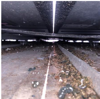
※パネルと屋根の隙間