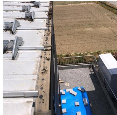
※雨樋に溜まった糞