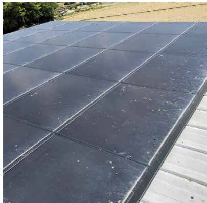
※太陽光パネル表面